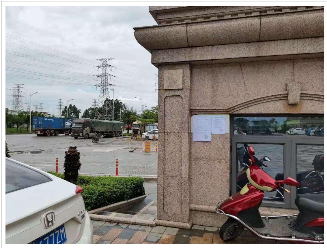
图3-4 征求意见稿现场张贴公示照片