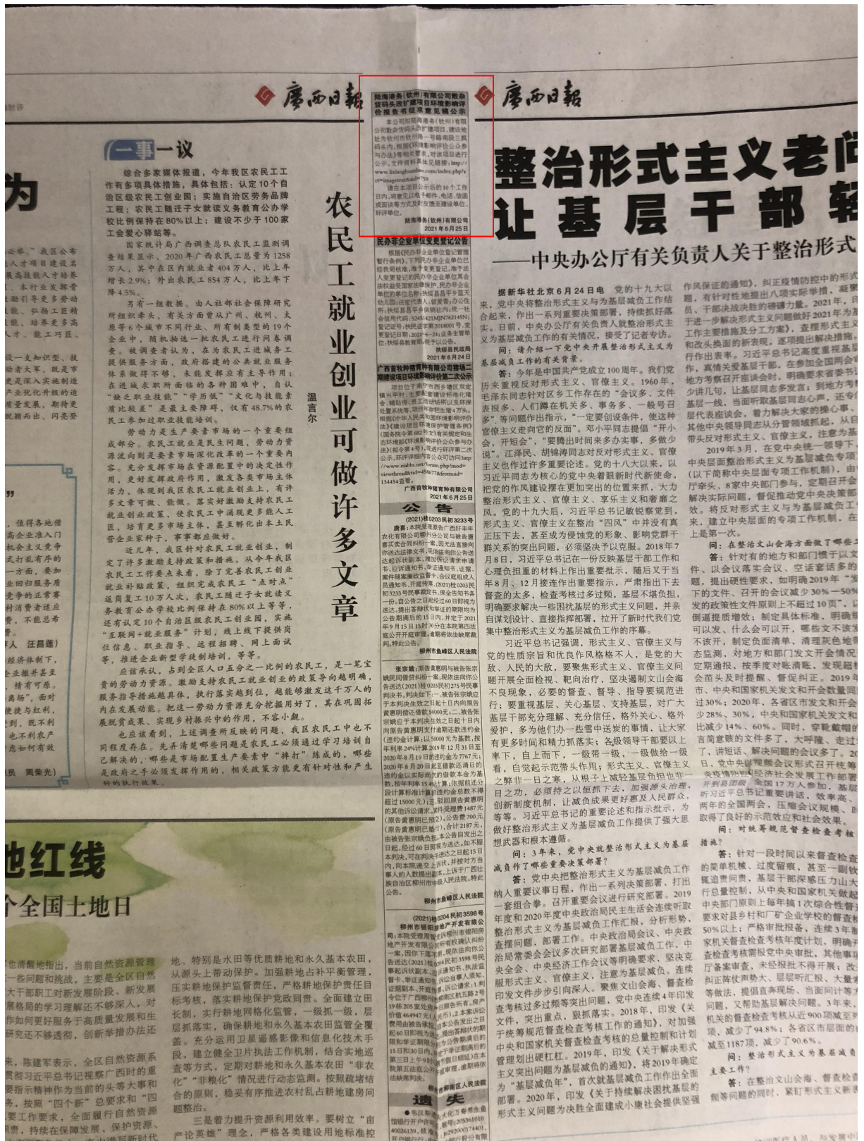
图3-2 本项目征求意见稿环境影响评价信息登报（第一次）公示照片

个工作日内刊登征求意见稿公示信息 2 次,载体选取符合《环境影响评价公众参与办法》要求。