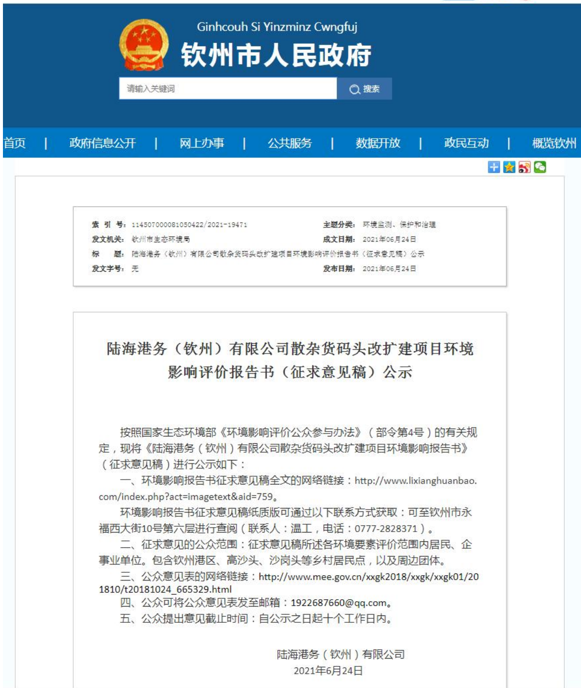
图3-1 征求意见稿网络公示截图